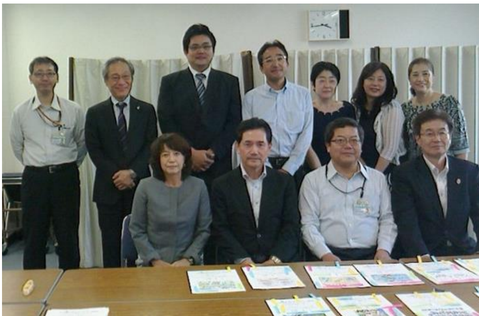
審査員のみなさま