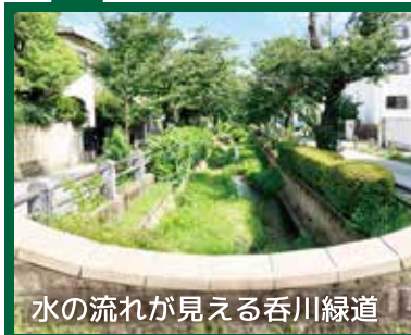
水の流が見える香川緑道