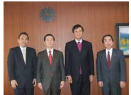
11月22日保坂世田谷区長(右から2人目)に提言書を提出