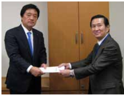
提言書を手渡す若宮衆議院議員(左)と大島税制委員長(右)