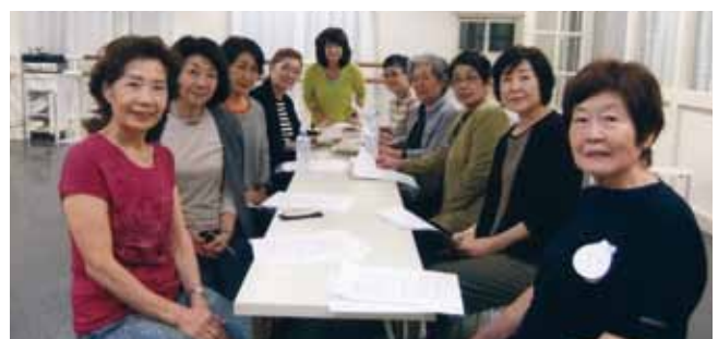
疲れもホグれて、スッキリした参加者の皆さん