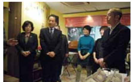
新入会員の皆さん