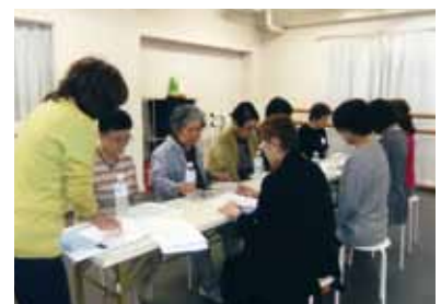
しっかりとNISAのお勉強?

トラクターの指導のもと、真剣にゆっくりと体を深い呼吸とともに動かしているうちに、疲れがとれてきてすっきりと元気な顔になりました。