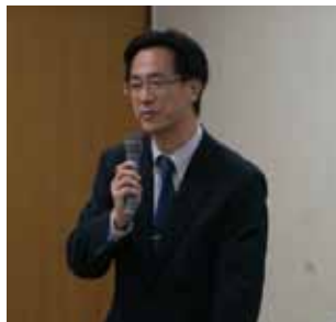
小竹第1統括官ご挨拶