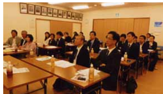
真剣に聞き入る受講者の皆さん