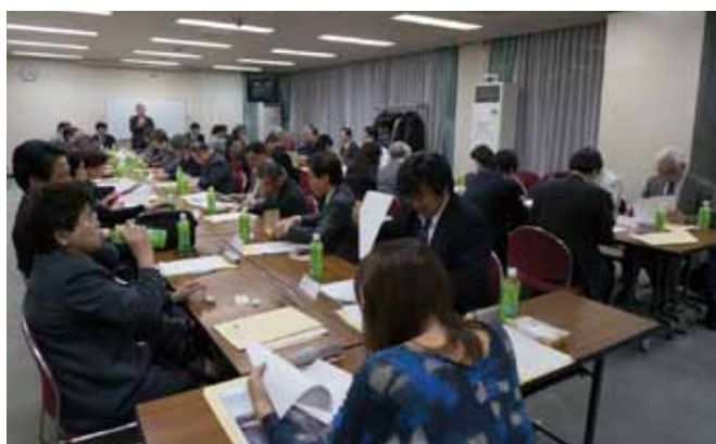
第5回 理事会の様子 平成25年11月26日