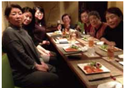
楽しい女性部会忘年会でした