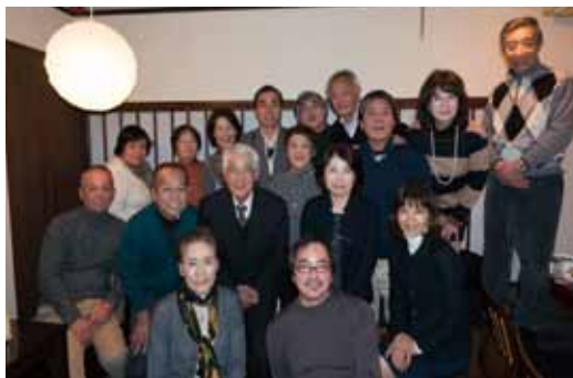
ワキアイアイの第1支部

あつぽん」において、第1支部の忘年会が開催されました。ここは、新鮮な国産鳥のみを備長炭で焼き上げているという、本格的にこだわった焼き鳥が人気で、しかもリーズナブルな価格で食べられるということで評判の良いお店です。それに店主はとても人柄が良く、子供連れの家族や大人数の宴会などのわがままな相談にも快く応じてくれます。もちろん、第1支部の会員でもあるのでみんなで盛り上げていきたいところです。第1支部は家族のような団結力の強い支部ですので、今年1年間のエピソードにも花が咲き「みんなで助け合いながら、来年も頑張ろう！」と、結束を新たにしたい会となりました。(第1支部 広報委員 船本貴一)