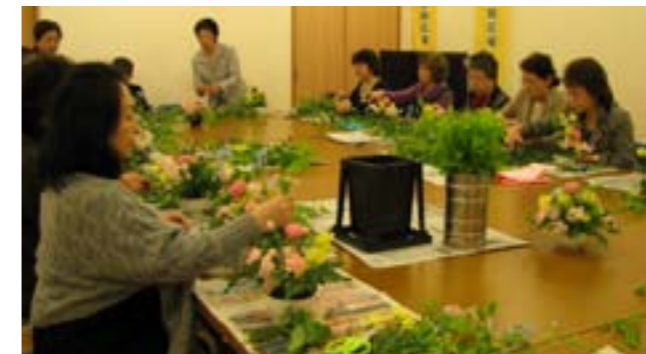
作品作りに奮闘中