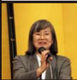
当選番号が次から次へと読み上げられる度、あちこちで喜びの声があがっていました。