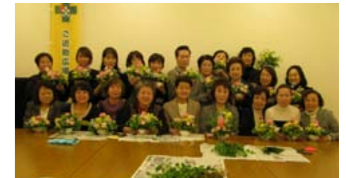
出来上がった作品にみんなニコリ