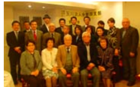
楽しく集った第4支部懇親会