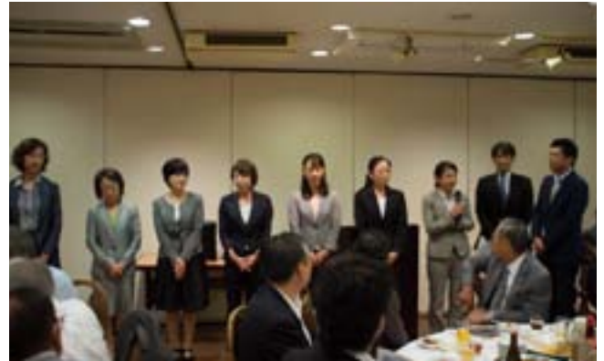
大同生命推進員の皆さん