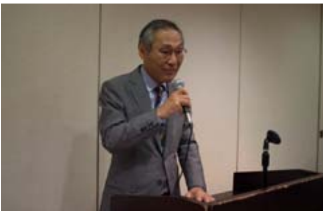
大鎌組織委員会担当副会長