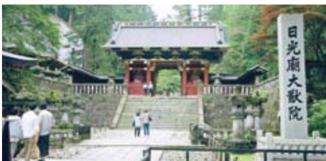
世界遺産の日光東照宮

その後東北道に入り、鬼平江戸廻としてリニューアルした羽生サービスエリアで最後の休憩をして、事故、怪我もなく、無事朝の集合場