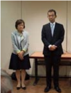
アメリカンファミリー担当者の皆さん