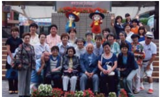
東武ワールドスクウェア前にて

たが、去年のバス旅行で、千葉の鋸山を歩き回った、その時の辛さを思い出してしまいました。2時間の自由散策の後いよいよランチとなりました。