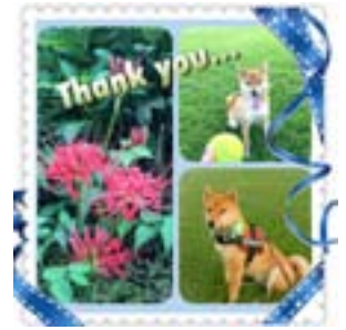
iPhoneで複数の写真をまとめたりデコレーションをしました

る内容で開催しました。写真加工のアプリはたくさんありますが、定番やおすすめのアプリをセレクト…皆さんお手持ちの写真を楽しく加工しまし