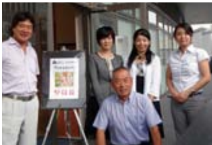
合同開催のパネル前で…

iPhoneをお持ちの方々は、メールや電話の機能と同じぐらいカメラをお使いになっ