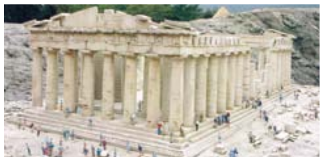
本物と見まごうパルテノン神殿