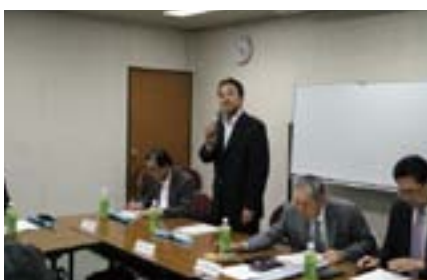
東山副署長のご挨拶