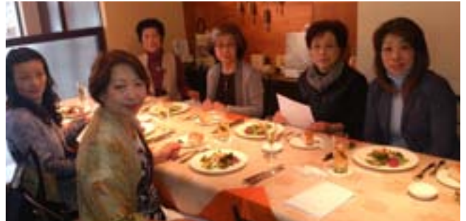
美味しそうな料理を前に