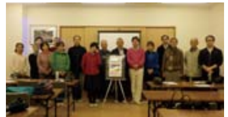
お疲れさま!笑顔で集合です

アップ!第8支部の上平支部長から「人間の目の直径は人種や体型にかかわらず皆同じ2.5cm