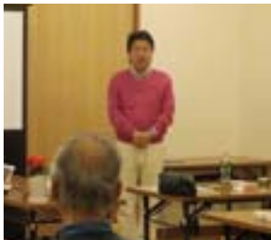
毎回楽しい挨拶の上平第8支部長

日時 3月4日(水) 13:00~15:00 場所 二子玉川ライズ 玉川町会会館 参加者 24名