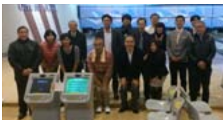
年齢は関係なし!みんなが盛り上がった大会でした

日時 2月17日(火) 17:30 場所 世田谷 オークラボウル 懇談会 用賀倶楽部 出席者 ボウリング16名/懇談会27名