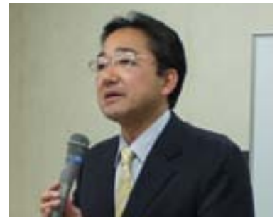
東山副署長のご挨拶