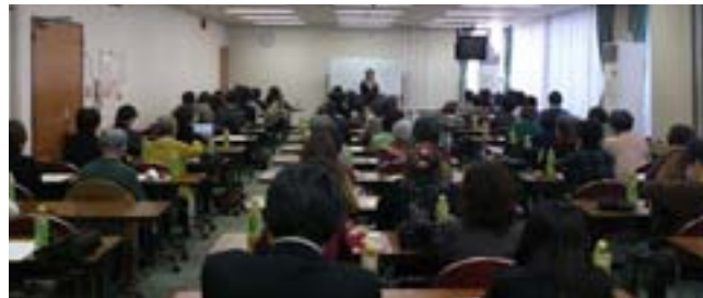
笑いもあり楽しい時間をすごした大盛況の講演でした