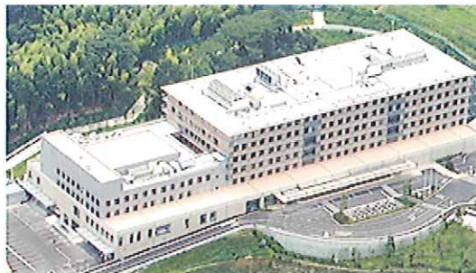
平成24年8月開院の新しく清潔な病院です。