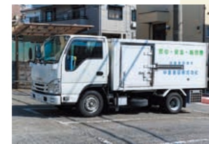
加工された食材は、自社のトラックで速やかに都内各地の小中学校へ配送されていく。生産者のもとまで赴き、直接仕入れる機会もある