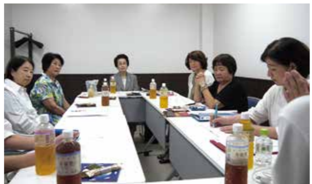
文章:田村 尚美(広報委員会 委員長)

※1時間半にわたる座談会、女性部会長のパワーを感じた貴重な時間でした。今後の課題は若い人にも女性部会に入ってもらいたい。そして、楽しい会であり続けたいということ。女性部会の楽しさや、やりがいをしっかり伝えていきましょう！