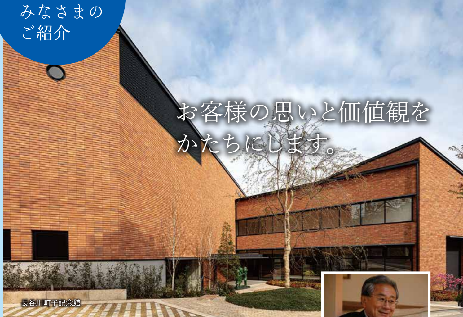
長谷川町子記念館