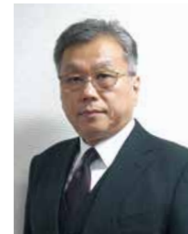
玉川税務署 署長 黒木 邦弘

新年が、会員企業の皆様にとって輝かしい年となります様、衷心よりご祈念申し上げ、年頭のご挨拶とさせていただきます。