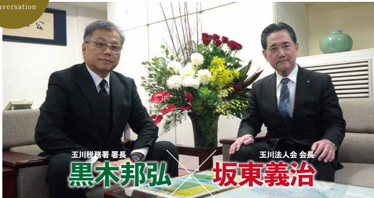
玉川税務署 署長 黒木邦弘