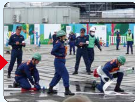
ホースをつないで・・・