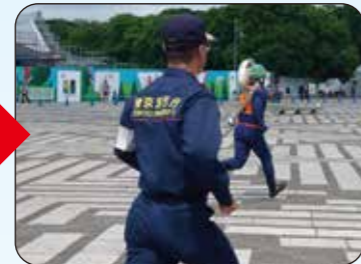
審査員も走ります!