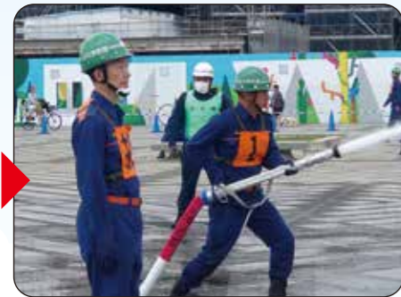
目標に向かって放水!