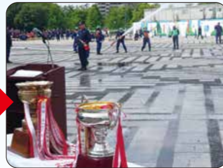
優勝カップの行方は・・・