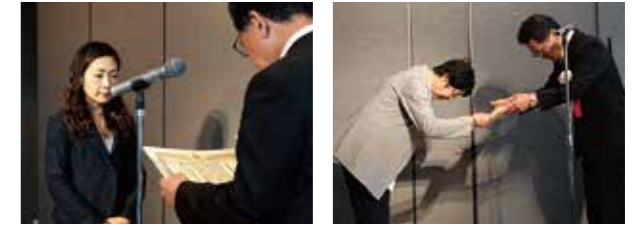
「絆ポイントキャンペーン」表彰の第9支部、第8支部代表