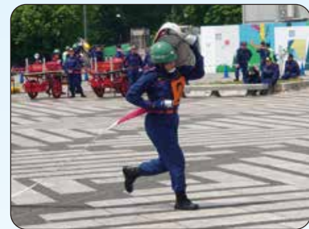
重たいホースを担いで・・・