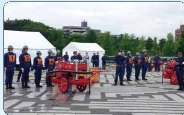
いよいよ始まります。

玉川消防団は、全部で11分団があり、その分団ごとにポンプや放水の技術を競うのです。ただし日頃、広い場所で訓練ができる分団は少ないようです。また、放水ができないため、皆さん些か緊張気味でした。更に、団員の皆さんは、本業の仕事が終わってから2時間程度の訓練です。疲れた体にムチを打ちながら、練習をしてこられたと思います。日頃の成果を本番で発揮できるかどうか、優勝に向けてがんばっておられました。