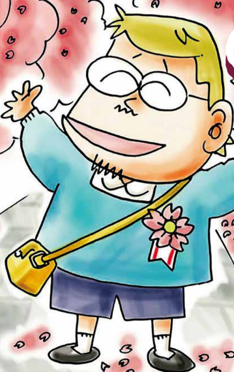
イラスト/やくみつるさん